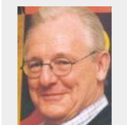
JOHN HOLMES um dos maiores publicitários do mundo fala sobre nosso mercado