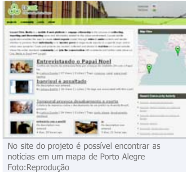
No site do projeto é possível encontrar as notícias em um mapa de Porto Alegre

Os leitores de Zero Hora têm uma nova forma de ver notícias. Através do site do projeto Locast é possível encontrá-las em um mapa de Porto Alegre, marcadas nos locais de onde foram enviadas.