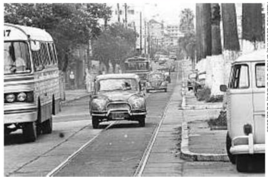
ALBERGO LUCCHINI, BANCO DE DADOS, 21/12/1969