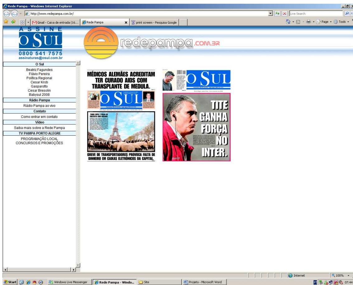
Ilustração 1 Homepage do site atual da Rede Pampa de Comunicação

O novo site como uma estratégia de comunicação e marketing: